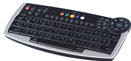
Διάφορα Τηλεχειριστήρια για το Σύστημα.